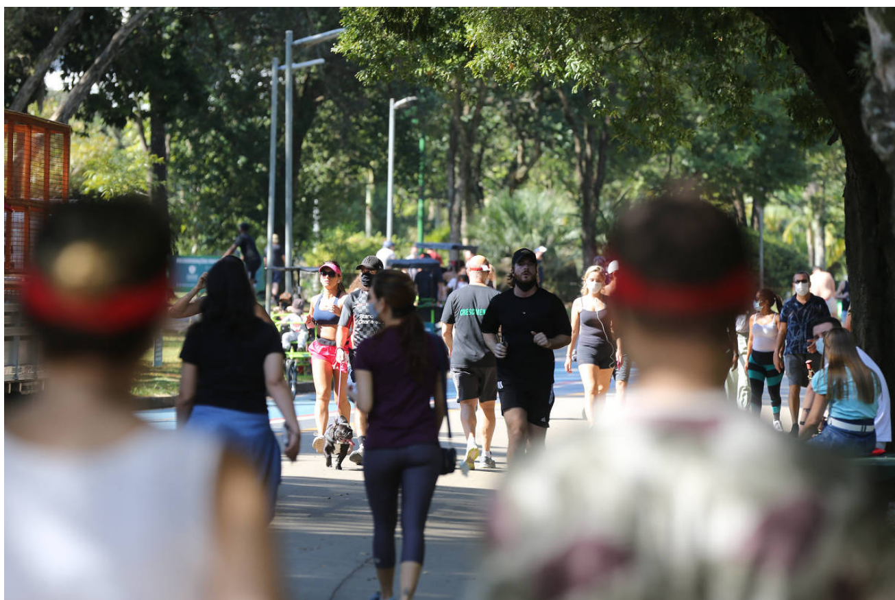
Pessoas circulam pelo parque Ibirapuera, em São Paulo - 3 jun.2021

No sentido contrário, a fatia com 30 anos ou mais subiu de 50,1% da população em 2012 para 56,1% em 2021. O grupo pulou de 99,1 milhões para 119,3 milhões no mesmo intervalo. O avanço foi de 20,4%.